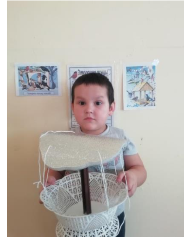
Кормушки для птиц из картона