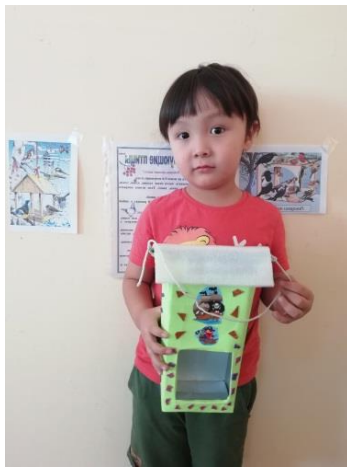
Рассматривание и развешивание кормушек для птиц.