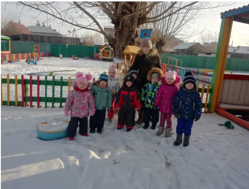
Пополнение кормушек кормом для птиц.